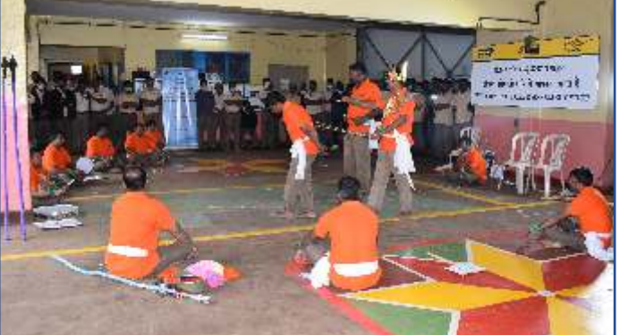
लघुनाटक द्वारा जागरूकता उत्पन्न करना